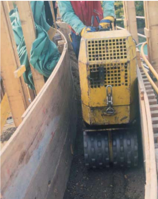
Abb. 1.1.1: Wirtschaftliches Verdichten des Wandkern-Bereiches mit der Schafffußwalze.