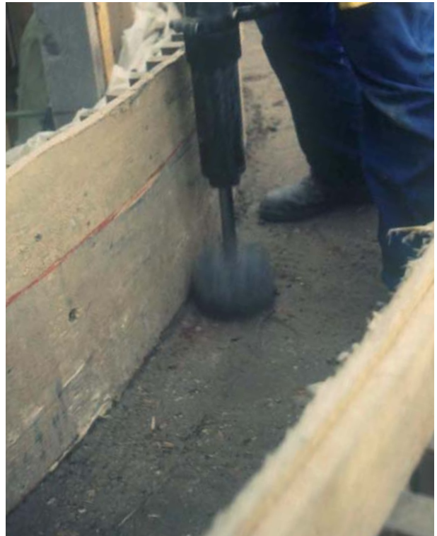
Abb. 1.1.2: Nachstampfen der Randbereiche mit dem pneumatischen Stampfer, geeignet auch für dünne Wände.