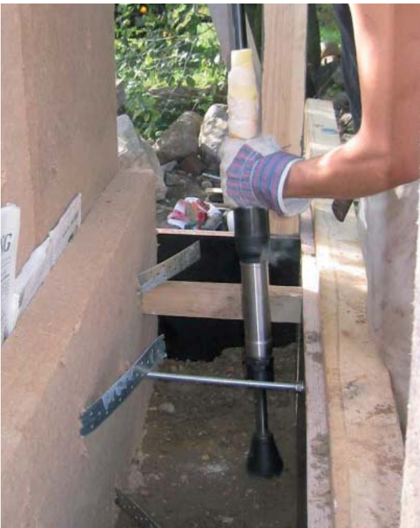
Abbildung 1.1.3: Der Kleinstampfer ermöglicht auch das sorgfältige Verstampfen kleinräumiger Bauteilbereiche.